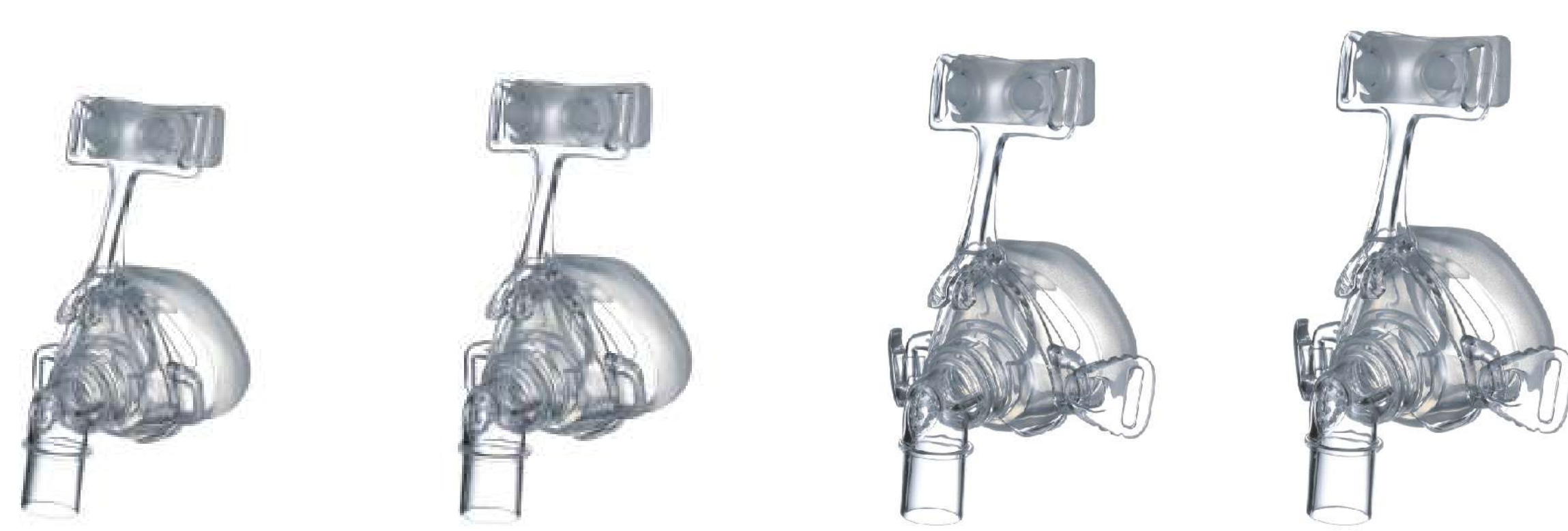
#11349 : Child S